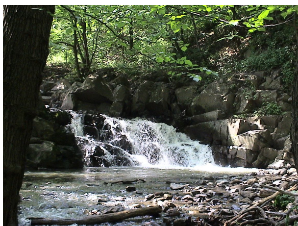
A Bükkös-patak vízesése Dömörkapunál