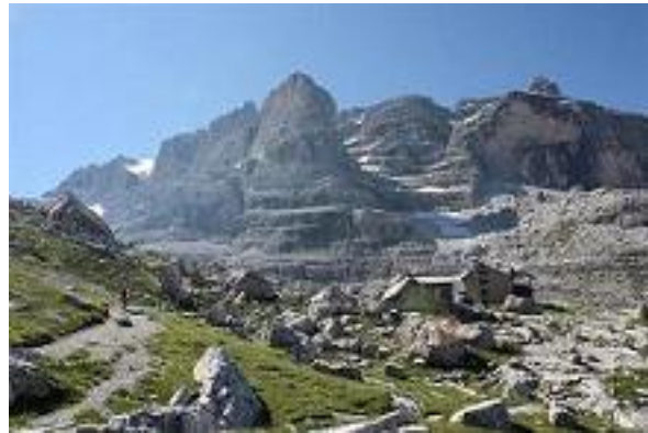
Brenta, Tuckett turistaház környéke