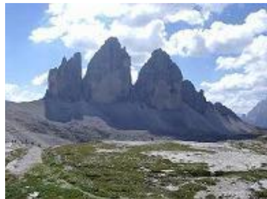
Tre Cime di Lavaredo