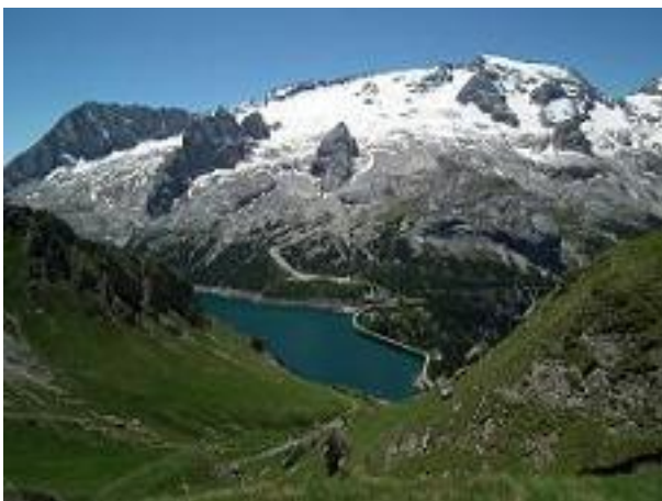
Marmolada és Fedaia tó a Via del Pane-ről