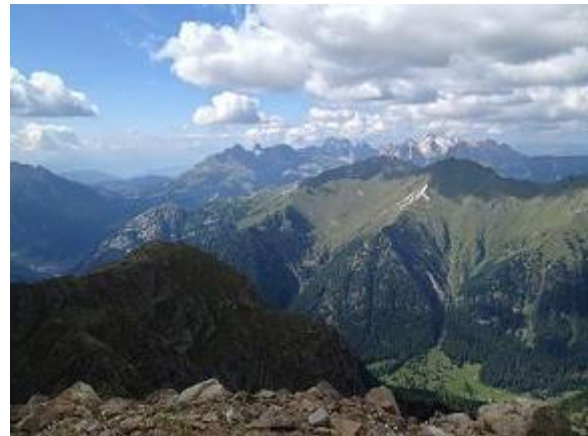
A Monzoni és a Catinaccio a Bocche csúcsról