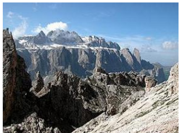
A Sella csoport a Piz Boeal