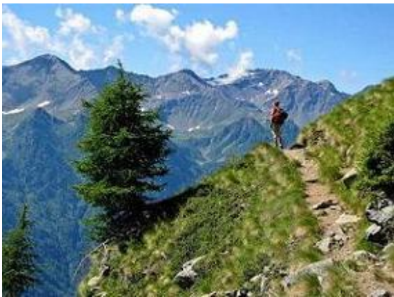
Cevedale – Németek útja