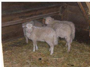
Budakeszi, 2008. május 8.

akik 2008-ban csatlakoztak a Pilis Parkerdő Budakeszi Vadaspark gondoskodóihoz, és